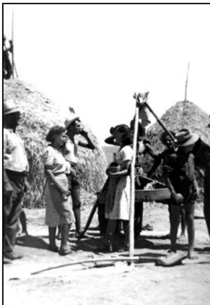
In una pausa della trebbiatura, ragazze offrono del vino

Nel senese e quindi anche nel montalcinese, la conduzione della terra a mezzadria ebbe luogo a iniziare dal 821 a.m. Questo rapporto di produzione significò l'appoderamento nelle campagne. L'uditore Gheradini censì nel territorio di Montalcino 445 poderi. Prima dell'introduzione della mezzadria nelle campagne, i lavoratori della terra abitavano dentro il castello. Con i poderi si costruirono le stalle per le bestie, a fianco del podere c'era l'aia, la concimaia, il capanno per gli arnesi, il pozzo per la raccolta delle acque, si dovettero costruire le strade poderali; Fu uno sviluppo produttivo senza precedenti.