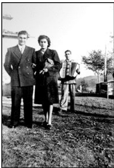
Scena di vita contadina: gli sposi e la fisarmonica.

Oltre alle vigne e ai frutti nel milleduecentotrentadue localmente c'era chi lavorava la feccia dell'olio; era il segno che nella nostra collina era già copiosa la coltivazione degli olivi. Nell'età moderna nel montalcinese l'olio d'oliva rappresentava il più alto reddito in agricoltura. Nei poderi del vescovo presso Castelnuovo dell'Abate i mezzaioli raccoglievano una grande quantità di olive che le frangevano nel frantoio della Curia vescovile.