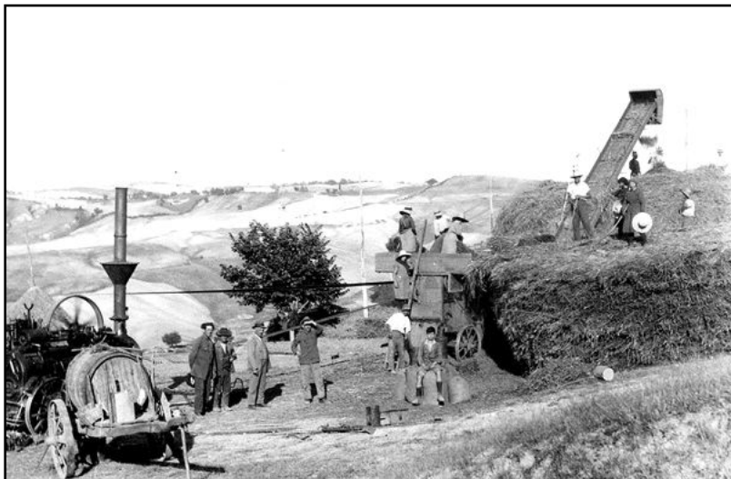
Una "trebbiatura" nell'aia

grande gelata del 1956 che “ bruciò” 122.000 piante di olivo su 182.000 piante censite la produzione dell’olio di oliva era di 20.000 quintali