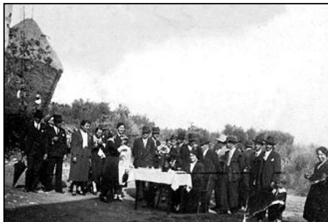
Scena di vita contadina: "Serrata" cioè rinfresco offerto da ogni famiglia che abitava lungo il percorso fra la casa della sposa e quella dello sposo.

Le cronache dei giornali di allora parlano di numerose delegazioni provenienti da tutta la Toscana in visita (all'oleificio moderno di Montalcino). Nei tempi più vicini a noi prima della