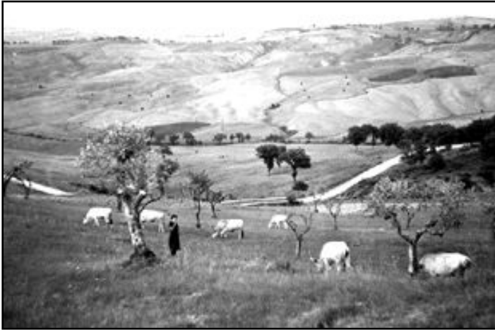
Anni '30. Pascolo allo stato brado

Ma i momenti più attesi nello stare insieme da parte delle famiglie mezzadrili erano in occasione delle feste e segnatamente durante i matrimoni. Gli sposi erano accompagnati dal suono della fisarmonica e in corteo nuziale composto da parenti e amici erano “fermati” ad ogni podere che incontravano lungo il percorso per un rinfresco preparato dalle famiglie in