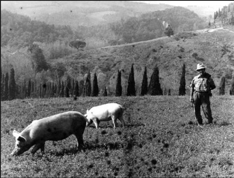
maiali al pascolo

Anche l'allevamento del bestiame, bovino, caprino, ovino di quest'ultimo grande richiesta nel mercato erano gli agnelli ed alta la domanda dei formaggi pregiati locali. Del resto anche oggi un caseificio locale della Fattoria dei Barbi produce un formaggio pecorino di alta qualità.