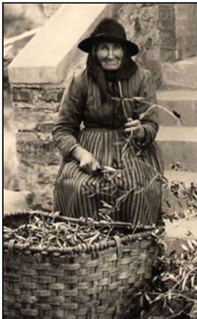
preparazione dell'alimentazione con la foglia di olivo per il bestiame vaccino nella collina di Montalcino. Aveva ragione chi scrisse nel lontano medioevo "I toscani tengano i loro prati sugli alberi"

Mentre nella collina si coltivavano "colture legnose" nella pianura la produzione del grano era tale da garantire nel Medio Evo uno staio di grano a bocca al mese. Uno staio di grano = a 20Kg. Nel montalcinese mai si registrano tumulti per la mancanza del pane fino alla occupazione francese nel 1811 quando i cittadini presero d'assalto i forni per sfamarsi. Nei tempi più recenti cioè durante la " battaglia del grano" voluta dal regime fascista e ciò per non dipendere dalla importazione di questo prodotto dall'estero, nel Comune di Montalcino erano vendibili 41 milioni di quintali i grano, oltre 20 staia pro capite all'anno. Fu un grande risultato se si pensa che allora la terra veniva lavorata e seminata con i buoi e la concimazione della terra era misera.