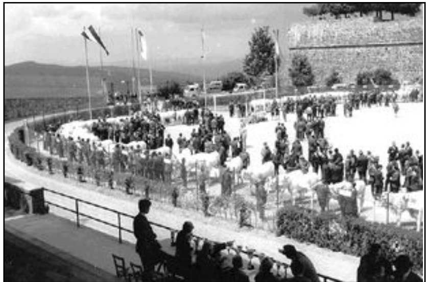
Rassegna bovina primi anni '60

svolgono dibattiti altamente scientifici sulla apicoltura, si assegnano premi alle persone e agli Enti che hanno operato a vantaggio della apicoltura. Si premiano giornalisti che con i loro articoli si sono impegnati a diffondere la cultura delle api e i vantaggi salutari che ne derivano dall'uso del miele.