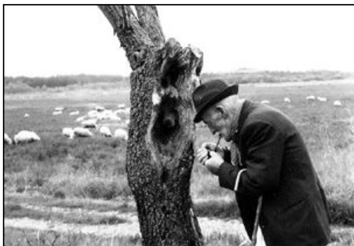
Le pecore al pascolo

Nel montalcinese ci sono più macelli che lavorano carni di suino realizzando prosciutti, salami, salsiccia, finocchiona, e altri prodotti tipici come il buristo (insaccato a base di sangue di maiale e dadini di lardo sale pepe e altri aromi) orliata (coppa), lombata di maiale nel punto più alto delle costole pepata, salata con finocchio avvolta nella carta paglierina che si consuma stagionata, soppressata specie di salame con carne della testa cotiche e dadini di lardo di maiale sale pepe e altri aromi pressato dentro un panno.