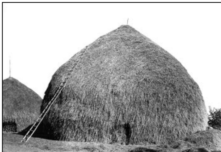
Pagliaio, sapienza contadina nella costruzione di esso

Quando nelle aie comparve la macchina trebbiatrice la battitura del grano avveniva con rapidità ma per fra fronte ai numerosi lavori era richiesto l'impegno di decine e decine di prestatori di opera che poi erano i componenti delle famiglie mezzadrili limitrofe che si scambiavano reciprocamente le prestazioni di lavoro.