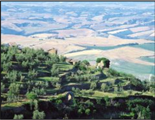
Un terrazzamento ancora esistente sulla collina di Montalcino

In concomitanza con la realizzazione dell'abitato di Montalcino fu disboscata la collina circostante per migliaia di ettari di terreno realizzando i terrazzamenti, usando le pietre estratte e poi scalpellinate per i muri a secco e per opere idrauliche, fosse di scolo e altro per rendere la terra in condizioni alla coltivazione delle "colture legnose" viti, olivi, e altri alberi da frutto che era il segno di una cultura evoluta e raffinata.