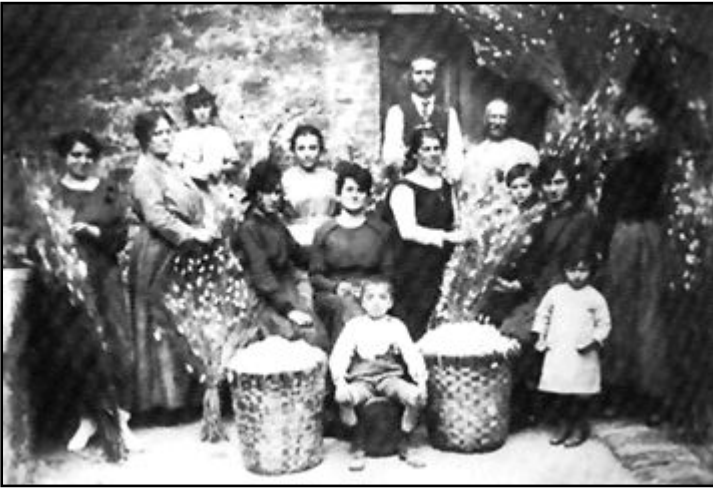
Anni '30. Lavorazione dei bachi da seta in via del Pino

L'agricoltura era nel "sangue" di gran parte della nostra popolazione. Negli anni sessanta quando in Italia il miracolo economico doveva essere rappresentato dalla industrializzazione i nostri giovani partecipavano a corsi di formazione per specializzarsi in potini, innestini ecc.